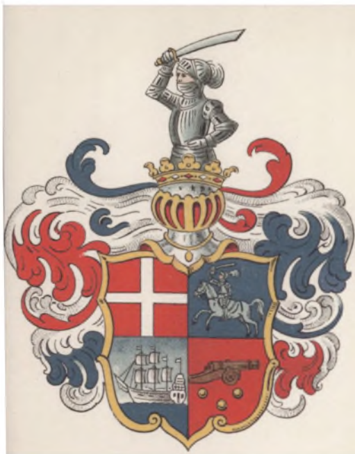
Admiral de Ruijters danske Vaaben efter Adelsbrevet af 1. Aug. 1680 (jfr. S. 137 f.).