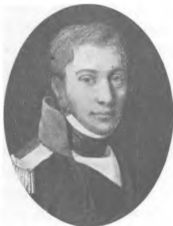
F. L. d'Auchamp, 1776—1847.

François Louis d'Auchamp 1) , født 31. Dec. 1776, kom 1798 til Danmark, anbefalet af Grev Løvendal, der havde kendt ham