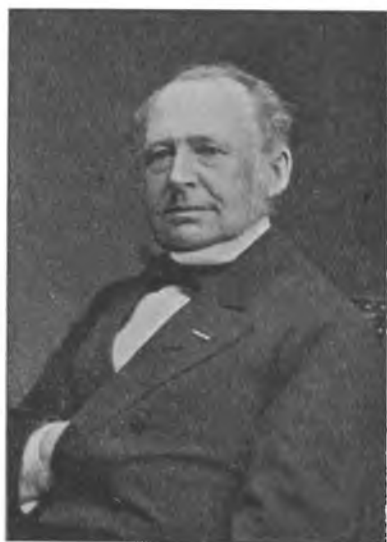
Gehejmekonferentsraad J. P. Trap.