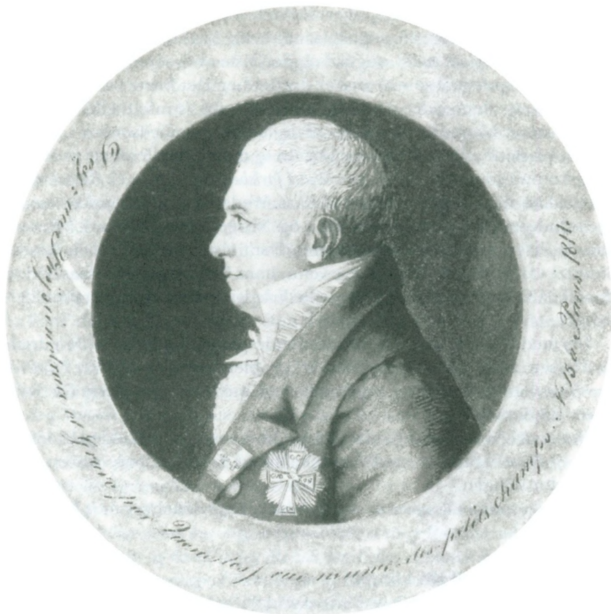
Frederik Julius Kaas.

selvfølgelig sin overordnede, general Armfelt, og resultatet ble det Kaas ønsket, nemlig å få et møte med Armfelt. Møtet fant sted 26. august på grensen ved Svinesund. 6